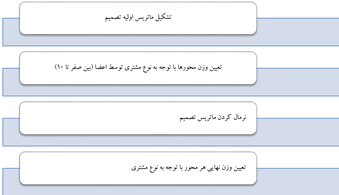
شکل ۱- مراحل تعیین وزن محورها با توجه به نوع مشتری

آن نوع مشتری ( G ، B و C ) قرار داشتند و هریک از آنها می‌بایست اهمیت سه محور را در مقابل این سه نوع مشتری تعیین نماید و برای نرمال کردن آن وزن هریک تقسیم بر مجموع اهمیت‌های نوع مشتری شد که در نهایت مجموع وزنی آن‌ها یک می‌شود. بدین صورت از نگاه هریک از