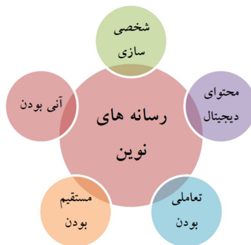
شکل ۳. ظرفیت و توانایی‌های رسانه‌های نوین

می‌گیریم به این معنی است که با یک ناحیه خاص تماس نمی‌گیریم (مثل تلفن ثابت) یا پیامی نمی‌گذاریم که ندانیم چه زمانی دریافت می‌شود، بلکه با شخصی خاص در زمان حال تماس برقرار می‌کنیم (فیلدمن ۱ ، ۲۰۰۵). بنابراین می‌توان نتیجه گرفت که فناوری‌های نوین اطلاعات و ارتباطات دارای توانمندی‌ها و ظرفیت‌های متنوعی هستند که در ساختار و عملکرد رسانه‌های موجود را متأثر می‌سازند و ویژگی‌های متعددی در آن‌ها ایجاد می‌کنند. (شکل ۳-۳) (پارسانیا، ۱۳۹۲)