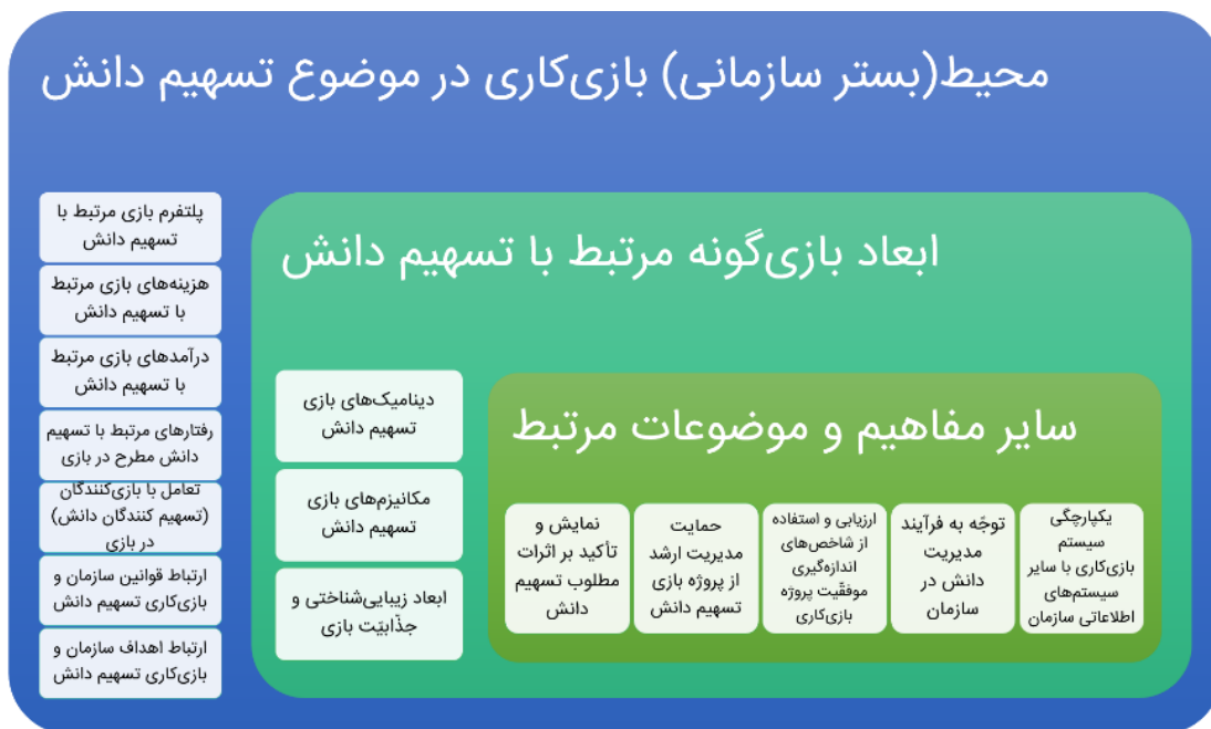
شکل ۴ - مدل‌سازی بصری یافته‌های پژوهش

دلفی برای طیف گسترده‌ای از سؤالات پیچیده، و در طیف وسیعی از زمینه‌ها استفاده می‌شود. در این روش، نظرات نخبگان مورد توجه است. به طور کلی روش دلفی، شامل چندمرحله اساسی است (اوکولی و پاولوسکی، ۲۰۰۴). در مرحله اول، مسئله پژوهش تعریف می‌شود و براساس آن ویژگی‌های لازم برای شرکت‌کنندگان در پانل دلفی تعیین می‌گردد. سپس نامزدهای مشارکت در این پانل شناسایی و از آنان دعوت به عمل می‌آید. در مرحله دوم روش دلفی، پژوهشگر، عواملی را از پیش تعیین و آن‌ها را برای نظرخواهی در اختیار اعضا قرار دهد. در مرحله سوم، اعضا میزان اهمیت عوامل را تعیین کرده و تعدادی از مهم‌ترین آن‌ها را انتخاب می‌کنند. مرحله چهارم به بازنگری در میزان اهمیت عوامل براساس نتایج قبلی اختصاص دارد (علیدوستی ۱۳۸۵). انتخاب اعضای مناسب برای پانل دلفی از مهم‌ترین مراحل روش به حساب می‌آید؛ چرا که اعتبار نتایج کار بستگی زیادی به شایستگی و دانش این افراد دارد (پاول، ۲۰۰۳). جهت استفاده از روش دلفی، محققان با ۴ تن از اساتید دانشگاه که در زمینه مدیریت دانش متخصص بوده و با مفاهیم بازی‌کاری نیز آشنا بودند، مصاحبه‌ای نیمه‌ساختار یافته داشته و ضمن تشریح مراحل روش نظریه‌پردازی داده‌بنیاد، ارائه یافته‌ها و مدل‌های بصری، درخصوص ارزیابی نظریه از ایشان نظرخواهی نمودند. پس از دریافت نظرات خبرگان، پیشنهادات مشترک و مطلوب از حیث جامع بودن و ارتباط با موضوع، جمع‌بندی شد.