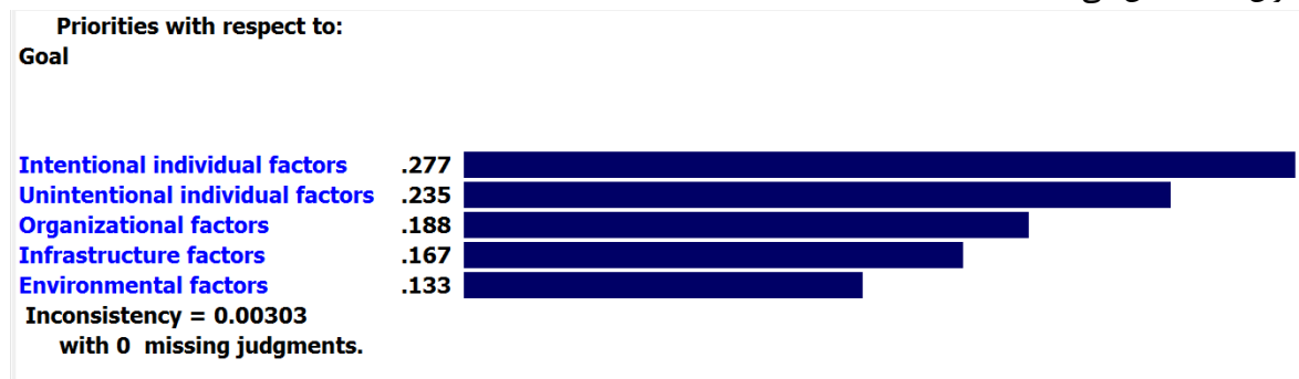
شکل (۷). رتبه‌بندی عوامل اصلی با استفاده از نرم‌افزار اکسپرت چویس

جدول (۹) نتایج ماتریس مقایسات زوجی برای وزن نسبی در سطح عامل‌های اصلی را بر اساس تاثیر بر نشت اطلاعات به عنوان هدف نشان می‌دهد.