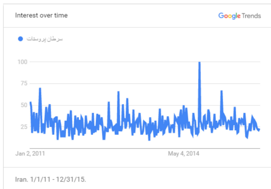
نمودار ۱. شاخص حجم جستجوی کلیدواژه «سرطان پروستات»

در نمودار (۲)، شاخص حجم جستجوی کلیدواژه « prostate cancer » در دوره زمانی یک ژانویه ۲۰۱۱ تا سی و یک دسامبر ۲۰۱۵ میلادی به تصویر کشیده شده است. طبق نمودار، یافته‌های حاصل از گوگل ترندز در این کلیدواژه نشان می‌دهد حجم جستجوی کاربران در موتور جستجوی گوگل بین سال‌های ۲۰۱۱ تا ۲۰۱۵ میلادی شیب نزولی داشته است.