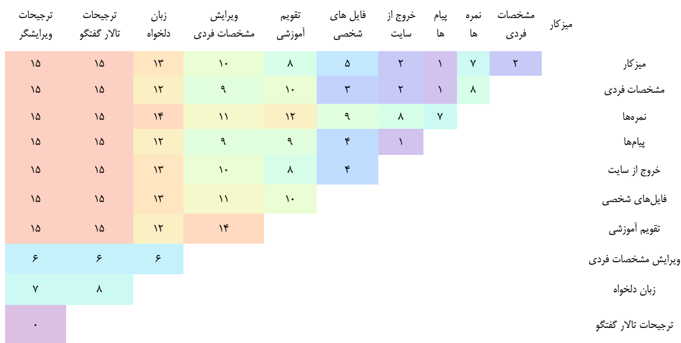
نمودار ۱. بخشی از نمودار ماتریس فاصله کارت‌ها

و همچنین در ادامه، قسمتی از یافته‌های ماتریس فاصله نشان داده شده است، اعداد نمودار نشانگر اختلاف بین کارت‌ها در هر جفت است. هرچه عدد پایین‌تر باشد، دو کارت شباهت بیشتری دارند و هرچه تعداد آن بیشتر باشد، مقادیر متفاوت‌تر هستند، بنابراین همان