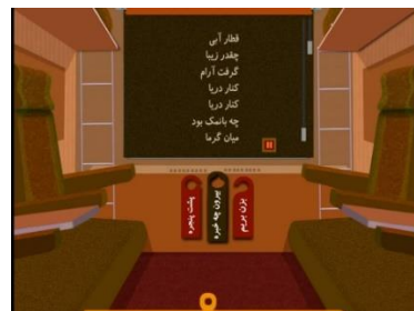
شکل ۴. صفحه اصلی کتاب قطار آبی: دریا

شعرها و تصاویر نسخه تعاملی و نسخه چاپی مجموعه قطار آبی یکی هستند اما کتاب برای نسخه تعاملی بازنویسی شده است. پرده پنجره در قطار هات اسپات است. با ضربه زدن روی آن پرده روی پنجره کشیده می‌شود و متن شعر روی آن ظاهر می‌شود. براساس انتخاب پیشین خواننده، این متن را یا راوی یا خودش خواهد خواند. سه هات اسپات دیگر نیز در نظر گرفته شده‌اند (شکل ۴): بزن بریم (با ضربه‌زدن روی آن قطار حرکت می‌کند)، بیرون چه خبره (متناسب با کتاب تصاویری متحرک از کوه، جنگل یا دریا نشان داده می‌شود. در این بخش جلوه‌های صوتی و هات اسپات‌های جدیدی در نظر گرفته شده است) و پشت پنجره (با انتخاب این مورد تصویری بزرگ‌نمایی شده از منظره پشت پنجره نمایش داده می‌شود).