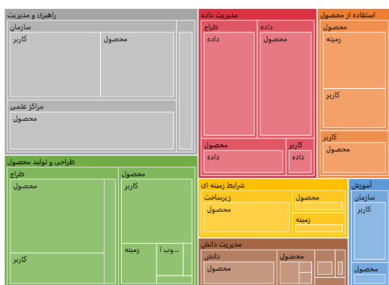
شکل ۲. هم‌پیوندهای همزیستی انسان-فناوری معنایی، به همراه عاملیت‌ها